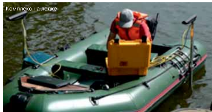
Комплекс на лодке

«Российский Олимп» призваны выявлять и поддерживать перспективные и надёжные компании, достижения которых являются гарантом цивилизованных рыночных отношений в России. Важным моментом здесь является стремление обеспечить развитие конструктивного диалога между бизнесом и властными структурами, а также содействие укреплению новых деловых союзов в России и за рубежом. Номинанты и лауреаты премии – организации с разной историей и подходами к ведению бизнеса, но всех их объединяет одно – неизменно высокая надёжность и качество предоставляемых услуг. Цели программы «Российский Олимп высоких